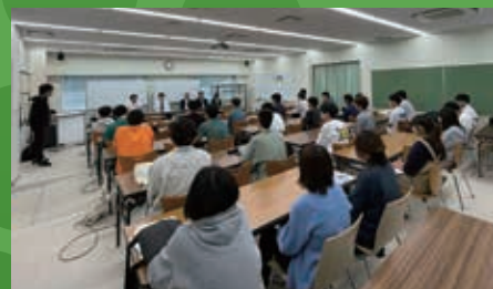
昨年の意見交換の様子