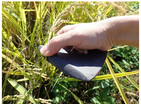
復元石庖丁による収穫実験（静岡市登呂遺跡復元水田）

また、落射照明型顕微鏡を用いて石器の表面を高倍率（100～500倍）で観察すると、珪酸体を含むイネなどの切断によって生じる特徴的な使用痕（微小光沢面）がみられる場合があります。考古資料と収穫実験で用いた復元石器の使用痕分析を比較することで、弥生時代の農耕技術をさらに実証的に明らかにできるものと期待されます。