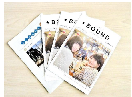
作成したフリーペーパーのイメージ