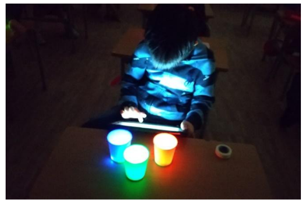
光の三原色との出会いから「遊び」「学び」「創造」が展開される

本研究では、これまで困難とされていた主体性や創造性を培う方法を汎用化可能な形で一般化し、作品主義や地球規模の諸問題に挑戦しながら、確かな美術教育の構築とグローバル時代を切り拓く人材の育成を目指します。