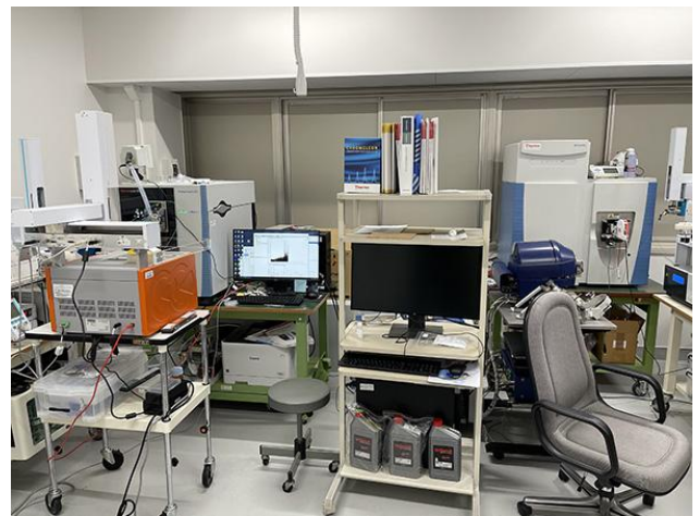
タンパク質解析用の質量分析システム

これらの技術は、がんや老化などで生じる複雑な細胞内プロセスの変化を読み解く手法を提供します。