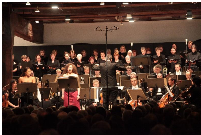
Requiem for Fukushima (オーケストラ作品)ドイツ世界初演 2012

私の研究室では、従来の作曲のほかに、GUI (グラフィカル・ユーザー・インターフェイス) を使い、アルゴリズムを用いた音楽作品の制作、システム構築などを行っています。芸術的な視点、表現方法と、数式など芸術領域以外の方法、概念を組み合わせることで、幅広い表現や様々な種類の音を生み出すことができます。芸術と工学の融合という新たな環境が、この研究を可能にしています。