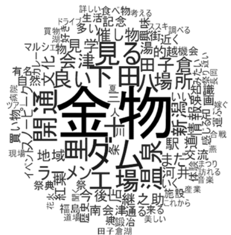
地域イメージの把握(一例:結果図は一部加工)