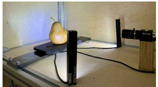
画像による外観品質判定装置 Appearance Quality Judgement System Using Image Processing

このように新潟県独自の、農家一軒一軒が導入できる安価で使いやすいICTシステムの研究開発を加速しなくてはならないと考えており、最新の機械学習技術やセンサ技術を取り入れながら、一歩一歩着実に進めています。