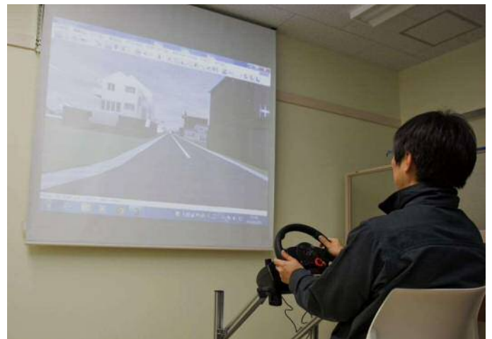
図1:ドライブシミュレータを用いた運転行動計測

将来的には、運転環境に対して危険を感じる能力や運転適性の定量評価を目指しており、先進安全装備の感性評価や、搭乗者の安心・快適性向上にむけた動作設定への応用が期待されます。