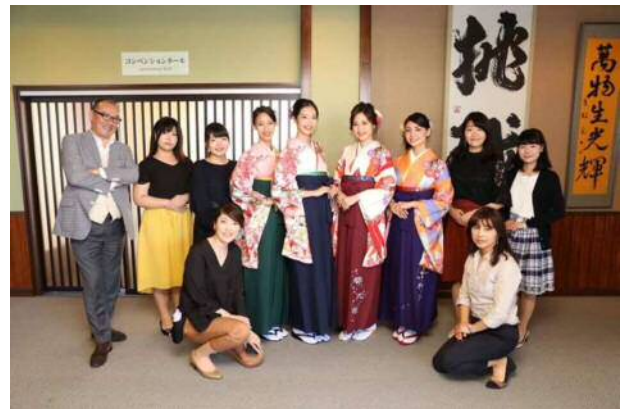
伝統工芸の活性化の取り組み(カワイイキモノプロジェクト)