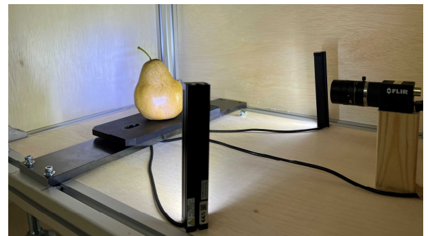
画像による外観品質判定設置 Appearance Quality Judgement System Using Image Processing

このように新潟県独自の、農家一軒一軒が導入できる安価で使いやすいICTシステムの研究開発を加速しなくてはならないと考えており、最新の機械学習技術やセンサ技術を取り入れながら、一歩一歩着実に進めています。