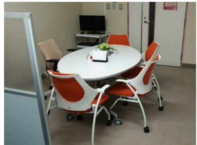
学生支援のための特別修学サポートルーム(新潟大学)