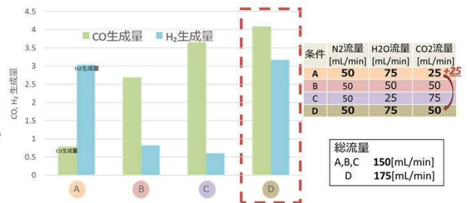
二酸化炭素と水の熱化学分解によるCOとH 2 製造例