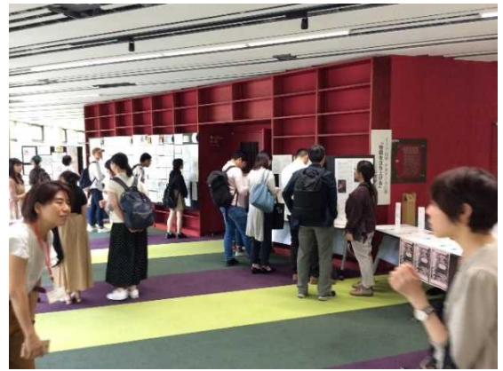
『王立宇宙軍 オネアミスの翼』アーカイブ中間素材展 (2019年6月14日 新潟大学ライブラリーホール)

本センターは、アニメ中間素材を入手・整理・保全しアーカイピングを推進することで、国内外のアニメ研究者に素材へのアクセスを提供する国際的な研究拠点として機能する一方、アニメーション制作および映像メディア業界、地域社会や自治体と緊密に連携し、研究成果を社会へ還元することを目指しています。