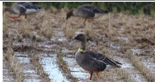
3G発信器を装着したオオヒシクイ。発信器から送信される位置・高度情報等を用い、センシティブティマップが作成される。

それを回避する有効な手法として昨今注目されているのが、鳥の衝突リスクを見える化した“センシティブティマップ”です。現在、衝突リスクの高い鳥種ごとにセンシティブティマップの作成方法を検討し、それをもとに広域マップを作成しています。さらに環境省と連携し、国内におけるセンシティブティマップの運用方法を検討しています。今年4月から施行された再エネ海洋利用促進法により、今後、洋上風力発電が大きく推進される状況において、センシティブティマップを用いたゾーニングは、鳥と風力発電の共存を図る有効な手段になると考えています。