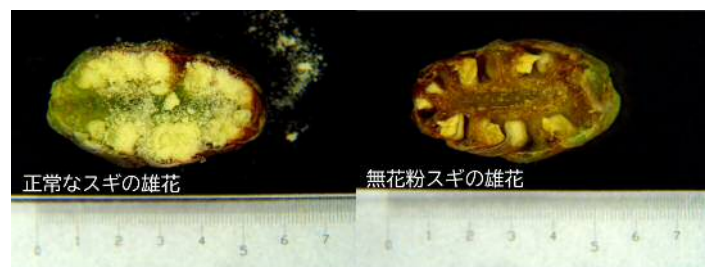
図1 スギ雄花の断面。 右が無花粉スギ、左が花粉の出るスギ。

現在は、無花粉スギの花粉崩壊過程の顕微鏡観察、雄性不稔遺伝子の連鎖地図へのマッピング、無花粉スギを判定するDNA解析手法の開発とマーカー選抜、組織培養による無花粉スギの作出技術の開発等に取り組んでいます。