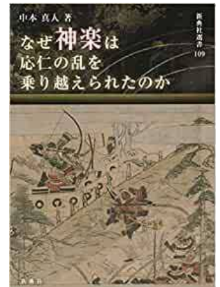
最近の研究成果（著書）