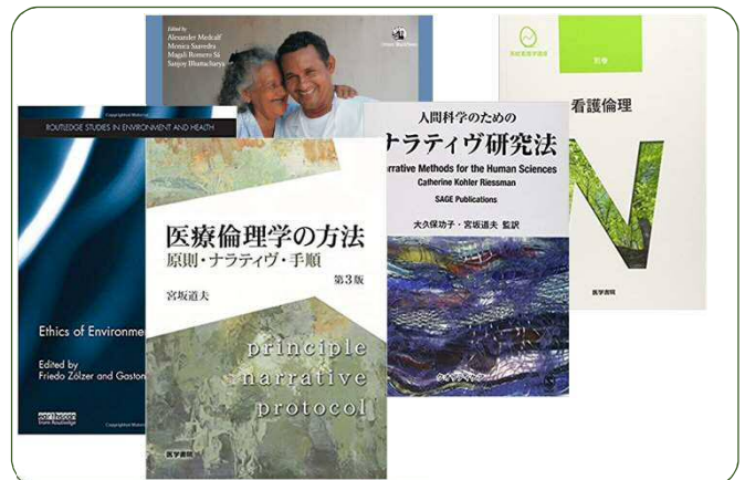
図2 研究の成果物としての図書等