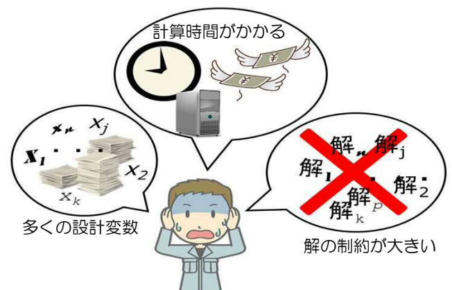
実問題の厳しい要求仕様

進化計算の最適化探索。複数の探索解（小さな円点）の fitness（評価値）を基に、最適化アルゴリズムに基づいて徐々に最適性能の設計解を探索。