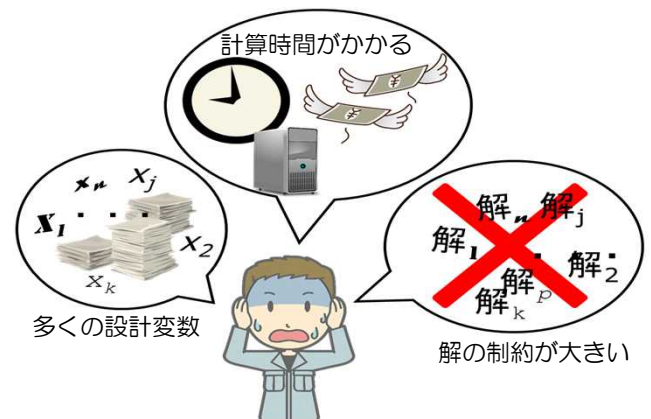
実問題の厳しい要求仕様

進化計算の最適化探索。複数の探索解（小さな円点）の fitness（評価値）を基に、最適化アルゴリズムに基づいて徐々に最適性能の設計解を探索。