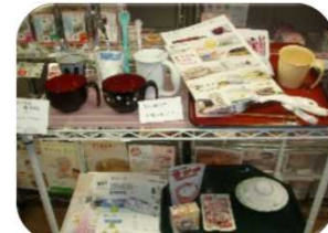
介護食品展示・試食・サンプル提供など