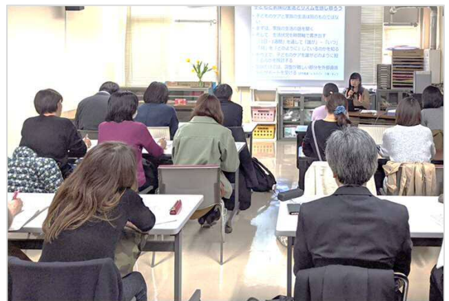
支援者がつながる「しゃんしゃん育ちの会」