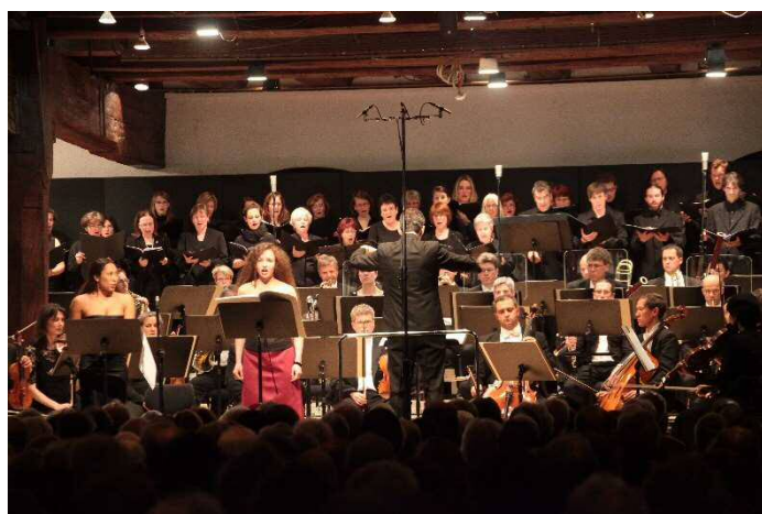
Requiem for Fukushima (オーケストラ作品)ドイツ世界初演 2012

私の研究室では、従来の作曲のほかに、GUI (グラフィカル・ユーザー・インターフェイス) を使い、アルゴリズムを用いた音楽作品の制作、システム構築などを行っています。芸術的な視点、表現方法と、数式など芸術領域以外の方法、概念を組み合わせることで、幅広い表現や様々な種類の音を生み出すことができます。芸術と工学の融合という新たな環境が、この研究を可能にしています。