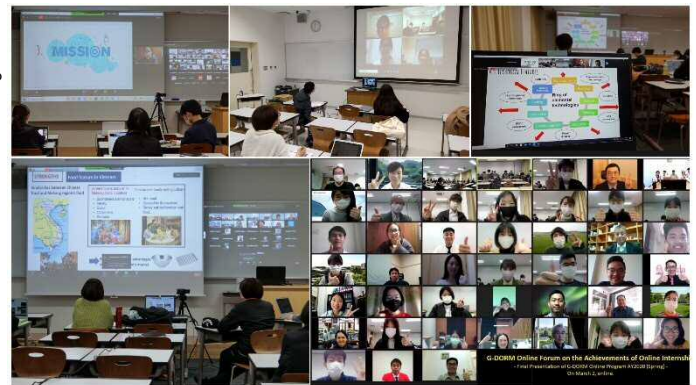
オンライン国際グループワークインターンシップの様子