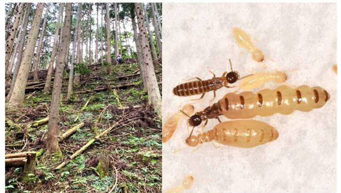
↑シロアリの王と女王は研究室内で世代を回すことが困難である。したがって、広大なフィールドから彼らを採集する能力が必要である。(左図) 研究対象のヤマトシロアリは特殊な繁殖様式を持っており、女王が単為生殖で次世代の二次女王を産む。王：上、女王：中、二次女王：下(右図)

具体的には、生物の長寿化をもたらす生体分子およびその機能を特定するため、シロアリの王と女王を材料にモデル生物であるキロシヨウジョウバエや培養細胞などの評価系を用いた分子機能解析をおこなっています。また、代謝活動は生物寿命と密接に関わっています。我々は、シロアリの真社会性に着目し、彼らのエネルギー代謝システム（特に、中心炭素代謝）を集団レベル・個体レベルで解析することで、生物に長寿化をもたらす代謝システムの実態解明に取り組んでいます。