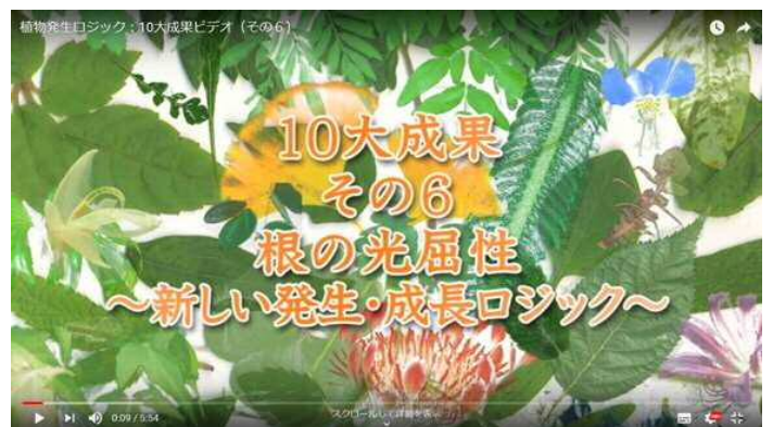
YOUTUBE動画「発生ロジック10大成果その6: 根の光屈性」

関連する知的財産論文等 Taro Kimura et al. (2021) Plant Physiology 187, 981-995. Taro Kimura et al. (2020) Plant Cell 32, 2004-2019. Ken Haga et al. (2015) Plant Cell 27, 1098-1112