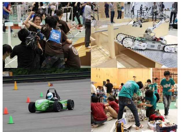
各大会での活躍の様子

各プロジェクトは、主に大学内の設備を使用しものづくりを行います。内容が高度化するにつれ、企業から物品・資金・技術提供を受けています。協力企業に就職した事例や、新入社員教育に活用されたこともあり、よい交流が生まれています。