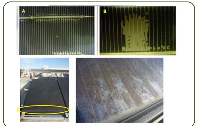
剥離型PIDを起こした太陽電池の外観