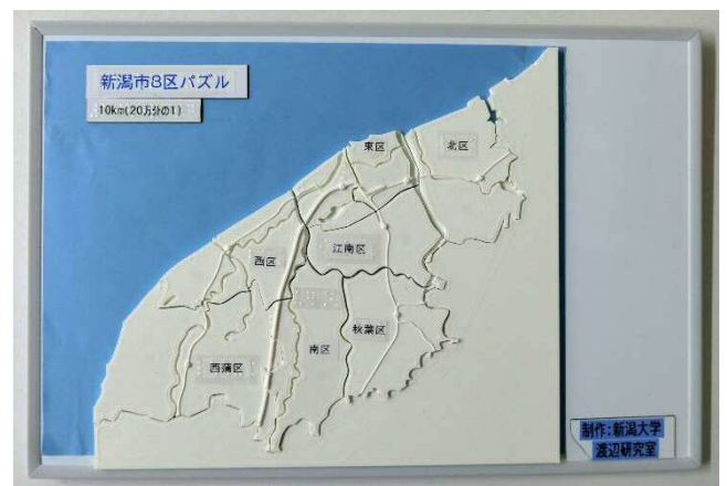
3Dプリンタで制作した新潟市8区パズル

視覚障害教育において立体物を触ることでものの概念形成を図ることは大変重要である。この視覚障害教育に必要な多種多様な立体模型を作成できるのが3Dプリンタである。しかし3Dプリンタの操作は決して簡単ではなく、とりわけ3Dデータの作成には3次元CADソフト（立体製図ソフト）の技術が必要であり、これを盲学校・視覚特別支援学校の教員が習得するのはハードルが高い。そこで大学、高専、工業高校など、3Dプリンタを使う技術を持ち、かつその技術を社会に役立たせたいという思いを持つ人々・組織の力を結集し、これをネットワーク化することで視覚障害教育に役立つ3Dデータの作成と立体模型の印刷を加速させる。